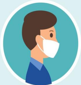
ناقل کووید ۱۹