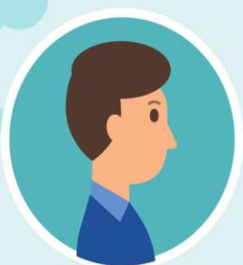
ناقل کووید ۱۹